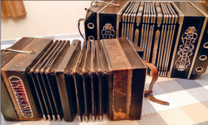
Chemnitzer Konzertinas um 1900