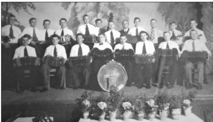
Konzertinaverin „Heimatklänge“ 1935 im Volkshaus Gornsdorf

Gästen die Konzertina und das Bandoneon sowie das frühere Gornsdorfer Musikleben vorgestellt wurden, waren nur ein Teil des Abends. Zur Umrahmung ihrer Ausführungen spielten beide Referenten mehrere Stücke aus alter und neuer Zeit, wie z. B. „Wenn in Großmutter Stübchen ...“, den argentinischen Tango „Jalousie“, „Wenn ich einmal reich wär“ und andere bekannte Melodien.