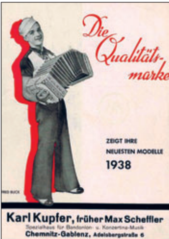
Werbeflyer der Fa. Alfred Arnold/Carlsfeld 1938

In Gornsdorf entstand 1907 der Musikverein „Freudenklänge“, in dem neben mehreren Blas- und Streichinstrumenten acht Konzertinas gespielt wurden. 1933 gründete sich der Konzertinaverin „Heimatklänge“ zu dem auch ein Jugendorchester gehörte. Wie aus alten Zeitungsinserten zu erfahren ist, trat dieser Verein bei zahlreichen Tanzveranstaltungen und Konzerten im Gornsdorfer Volkshaus sowie in den Nachbarorten auf. Die Beliebtheit dieser Harmonikas war damals enorm. 1930 gab es deutschlandweit etwa 1.000 bis 1.200 Vereine mit rund 14.000 bis 30.000 Spielern.