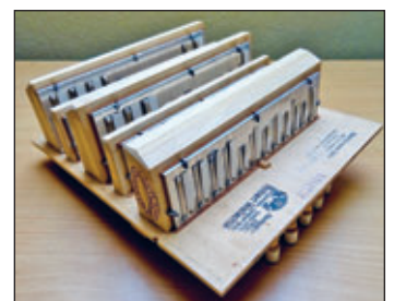
Stimmplatten mit Stimmzungen im Bandoneon

Carlsfeld im Erzgebirge war bis Mitte des letzten Jahrhunderts das Zentrum des Konzertina- und Bandoneonbaues. Die Harmonikas der Firmen ELA und Alfred Arnold waren wegen ihrer ausgezeichneten Qualität gefragt und wurden in großer Menge nach Südamerika exportiert. Während in unserer Heimat Konzertina und Bandoneon kaum noch zu hören sind, „überlebten“ sie in Argentinien bis in die Gegenwart und entwickelten sich aufgrund ihres besonderen Klanges zu den typischen Instrumenten des Argentinischen Tangos