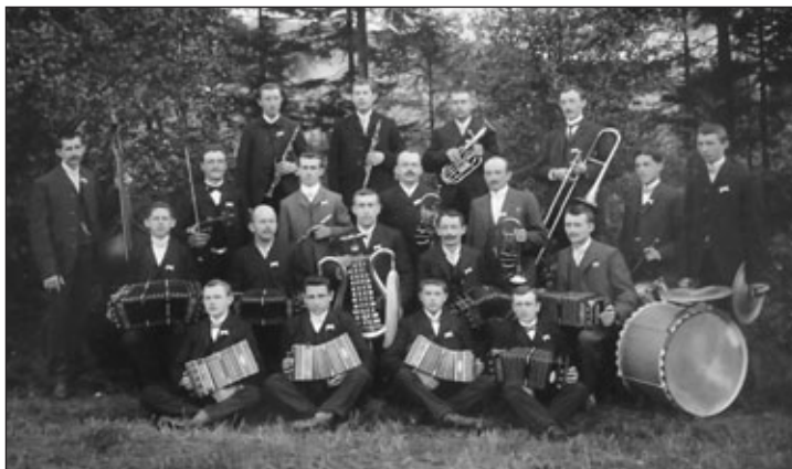
Musikverein „Freudenklänge“ 1907